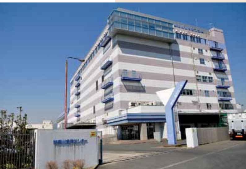
神奈川食肉センター