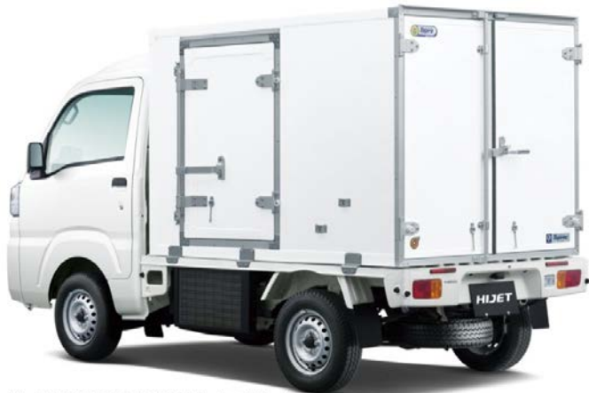
Photo: 4WD 4AT 左サイドドアはメーカーオプション