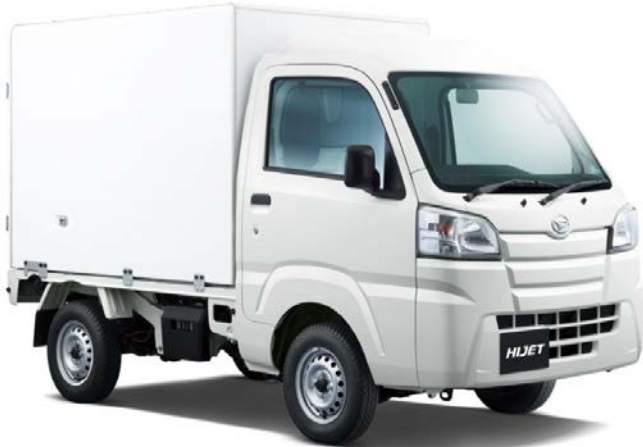
Photo: 片側スライドドア仕様 4WD 4AT