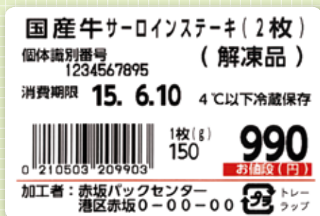
<パックラベルの記載例>

「ステーキ2枚入り990円」「切り落とし300g入り1パック580円」等、重量を一定にし、均一価格でパック販売する場合。